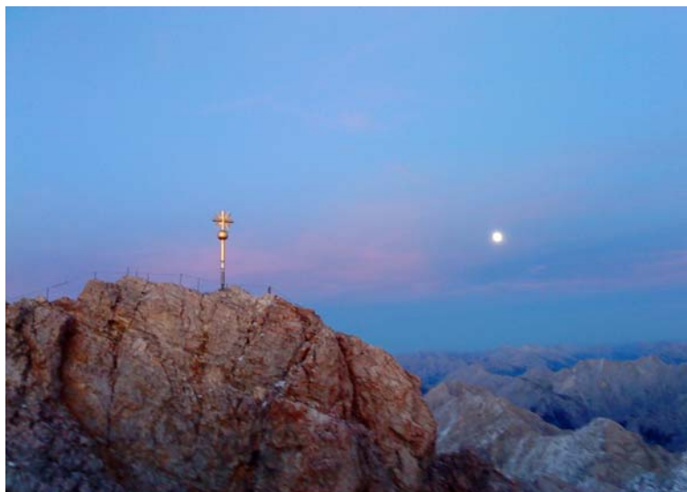
Abendstimmung auf der Zugspitze