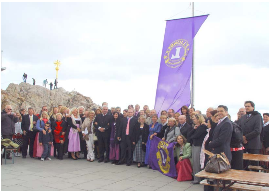
LIONS-Flaggenhissung „auf höchstem Niveau“

Pünktlich zum Vollmondtag am 16. Juli 2011 waren zur großen Freunde aller Clubmitglieder ungewöhnlich viele Amtsträger und Lionsfreunde anderer Clubs dieser ungewöhnlichen Einladung gefolgt. Mit der Eibsee-Seilbahn ging es bei besten Wetterbedingungen auf die Zugspitze, wo die Präsidentin die Gäste zum Sektempfang im Freien begrüßte. Als die Musik ertönte, wurde unter großem Beifall ehrfürchtig die erste Lionsfahne auf der Zugspitze gehisst. Was für ein Moment!