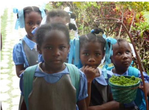
Die Bauarbeiten gehen zügig voran (Anfang Juli 2011).

Die Bauarbeiten wurden bereits begonnen. Die Ausschreibungs-Unterlagen, die Baufirma und die Vergabe wurden von Experten der action medeor genau geprüft und für gut befunden. Der Baufortschritt wird ständig überwacht. Es ist geplant, die Gebäude bis Ende Oktober fertig zu stellen und unmittelbar darauf mit dem Unterricht zu beginnen.