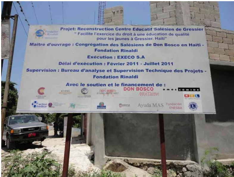
Die Bautafel an der Schulbaustelle in Gressier

Es handelt sich um ein komplexes Projekt mit mehreren internationalen Geldgebern. Durch die Entscheidung für ein großes Projekt kann mehr Menschen geholfen werden, als es mit kleinteiligen Projekten der Fall wäre. Die Trägerschaft und der zukünftige Unterhalt liegt bei den Salesianern DON BOSCO. Der Gesamtbedarf für die Grund- und Sekundarschule liegt bei über zwei Millionen Euro.