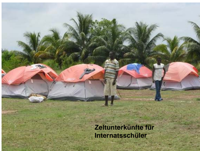
Zeltunterkünfte für Internatsschüler

Zu Gute kommt dieses Projekt bis zu 350 sozial benachteiligten Kindern und Jugendlichen, seien es nun ganz oder teilweise Waisen, ehemalige Straßenkinder, oder einfach junge Menschen aus verarmten Verhältnissen, deren Familien nicht für die Unterkunft,