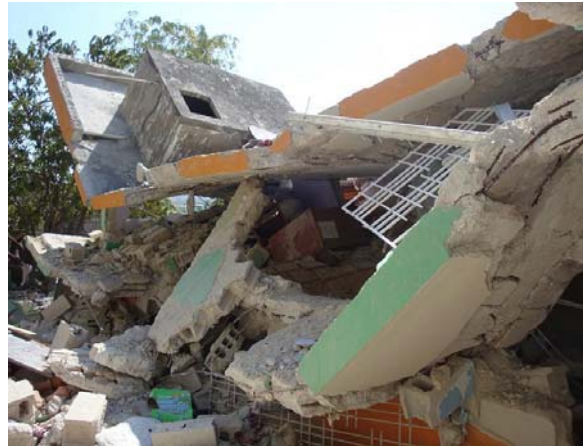
Zerstörte Schule in Port au Prince

Inzwischen leben die Menschen immer noch unter katastrophalen Bedingungen. Die Cholera breitet sich weiter aus und erschwert den Aufbau. Zahlreiche Menschen sind bereits gestorben. In dieser Situation geht es vor allem darum, den Kindern zu helfen. Ohne Schulbildung und ohne eine warme Mahlzeit täglich haben die Kinder keine Chance. Wie schon so oft, ist unser Engagement bemüht, nachhaltig zu wirken.