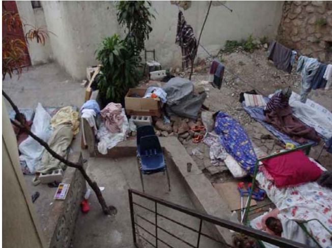
Aus Angst vor neuen Erdbeben schliefen viele Menschen im Freien.

Ein verheerendes Erdbeben hat am 12. Januar 2010 eines der ärmsten Länder dieser Erde erschüttert: Haiti, Zahlreiche Nachbeben folgten bis heute. Rund 230.000 Menschen starben. Viele Tote liegen bis heute noch unter den Trümmern, wenngleich schon riesige Schuttberge weggeschafft wurden. Mehr als zwei Millionen Menschen wurden obdachlos. Unzählige Kinder haben Eltern und Heim verloren. Viele Einrichtungen einer ohnehin maroden Infrastruktur, wie Schulen, Kindergärten, Waisenhäuser und Krankenhäuser sind zerstört. Die großen Hilfsorganisationen haben vielfach nach Maßnahmen der Soforthilfe das Land verlassen. Korruption und Gewalt blühen.