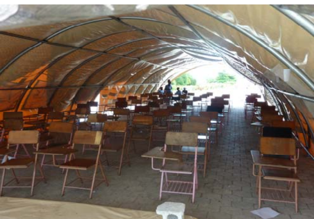
Behelfsunterrichtsraum im Zelt

Hier kamen wir gerade rechtzeitig, um in ein gemeinsames Wiederaufbauprojekt in Gressier (25km westlich von Port-au-Prince) mit den Komponenten Unterkunft (Internatsgebäude), einer kombinierten Grund- und Sekundarschule sowie einer Einrichtung zur Gesundheitsversorgung einzusteigen. Die